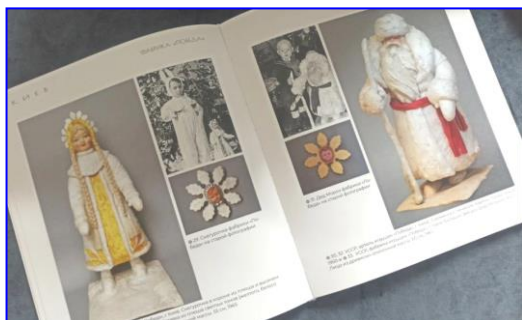
Фото из книги В. Чекалкиной "Дед мороз и Снегурочка".

Часто личики ввозились в СССР из Германии; и мастера, и мастерицы сами приклеивали их на картон, вату, фольгу и бумагу.